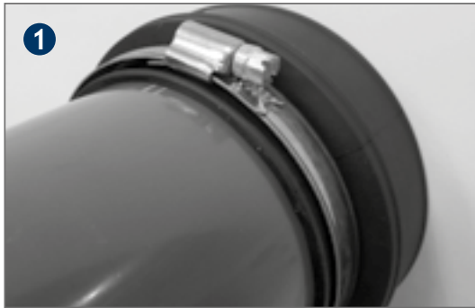
Place the strap