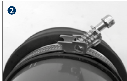
Contract tensing strap