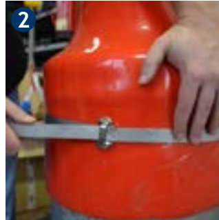
2 Strongly tighten steel strap at fastening strap.