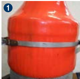
1 Vorkonfektioniertes Spannband für den entsprechenden Rohrdurchmesser umlegen.