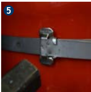
5 Bend flap with hammer to secure steel strap.