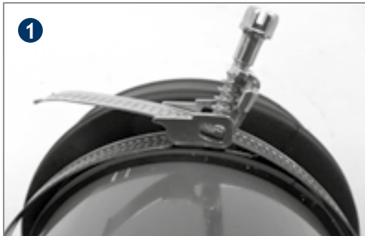
Thread tensing strap