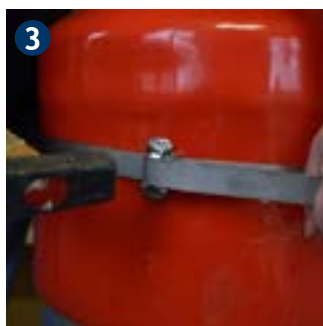
3 Spannband um den Verschluss knicken und anschlagen.