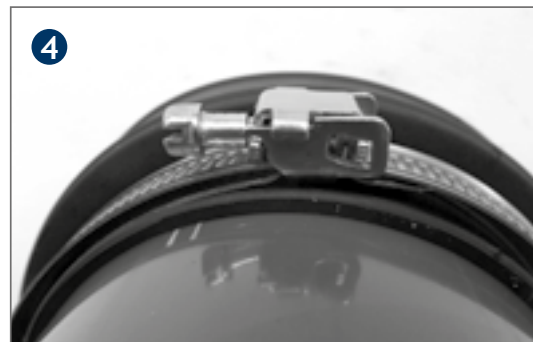
Snap lock into place