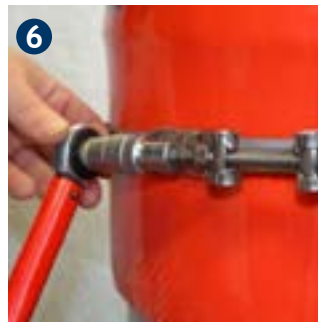
6 Fasten steel strap ring with screw cap. (In case of using multiple screw caps tighten evenly).