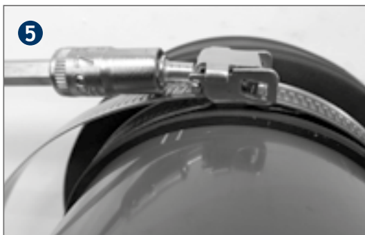
Place the strap and tighten the strap