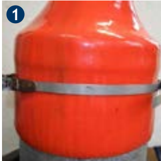
1 Fit prefabricated steel strap according to the pipe's diameter.