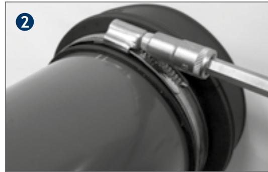
Tighten the strap with a socket spanner