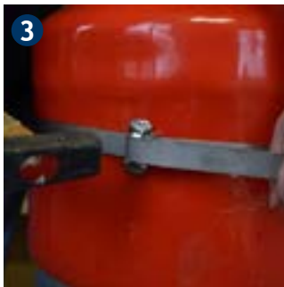
3 Bend steel strap at fastening strap and fix with hammer.