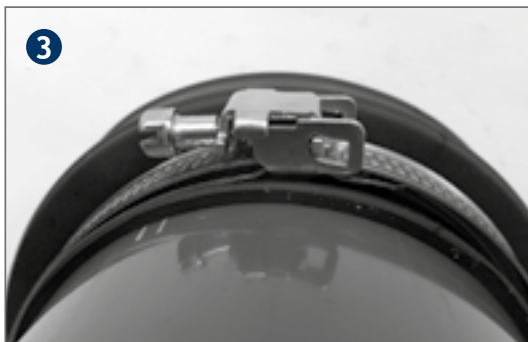
Fold the closure